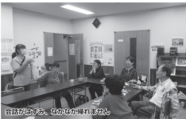
会話がはずみ、なかなか帰れません

たところ、「好きな料理でならお手伝いしたい」と賛同してくれる友人が現れました。住民有志が集まり、地域の未来を楽しく考える懇話会で発案すると、他の人も「おもしろそう！」「やってみようよ！」と後押ししてくれたそうです。いざ開催してみると、用意したおにぎりが全てなくなる盛況ぶり。ある人が