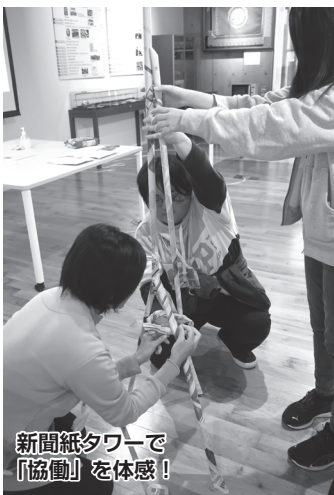
新聞紙タワーで「協働」を体感！