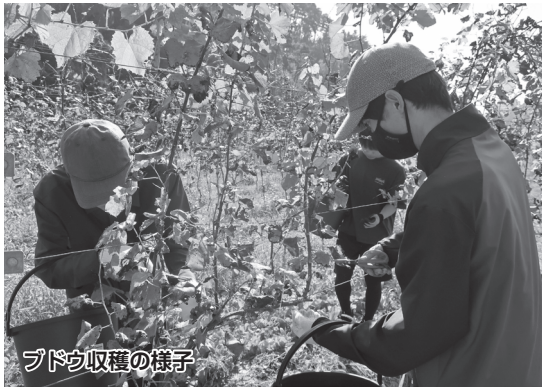
ブドウ収穫の様子

委員会が活動を始めたのは初夏のこと。学生たちは「あのブドウがこんな大きくなってくれいい」「小さな実の摘果が大変だった」と話しながら収穫作業に励みました。