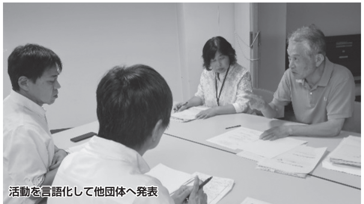
活動を言語化して他団体へ発表