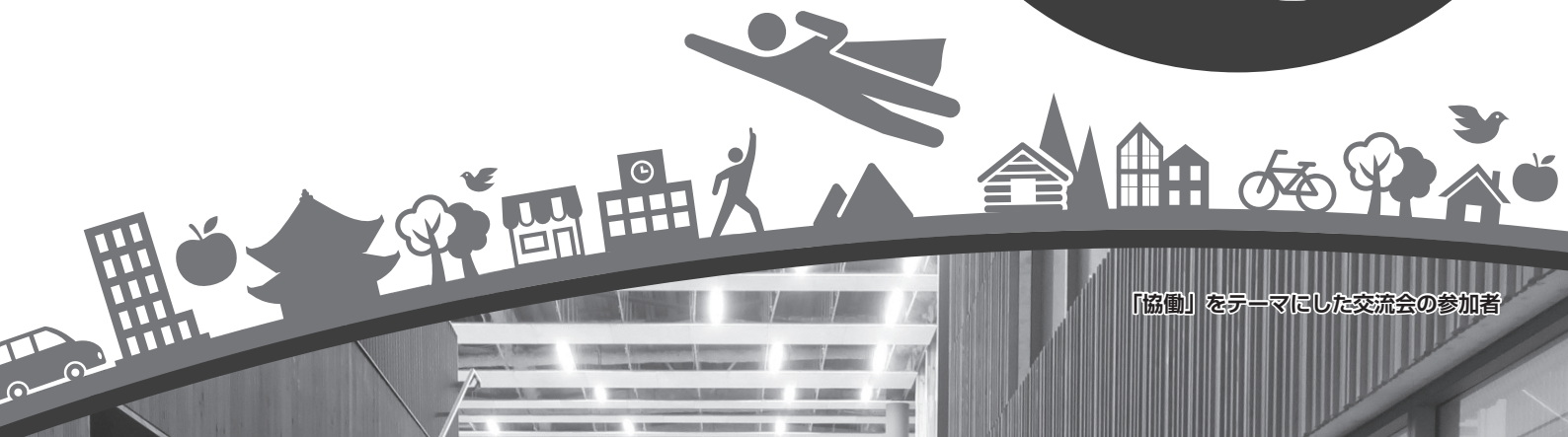
「協働」をテーマにした交流会の参加者