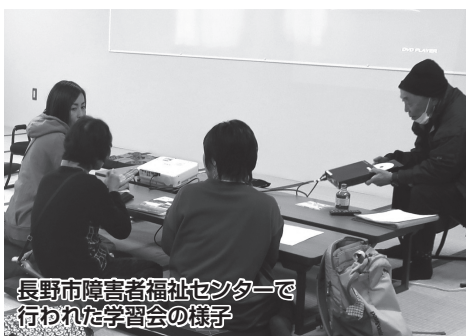
長野市障害者福祉センターで行われた学習会の様子

活動は年間を通して行っていて、見学は自由です。興味のある方の参加をお待ちしています。