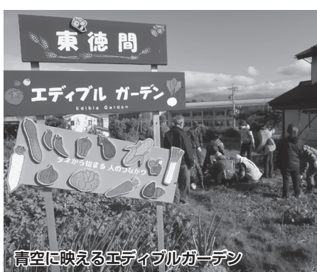
青空に映えるエディブルガーデン