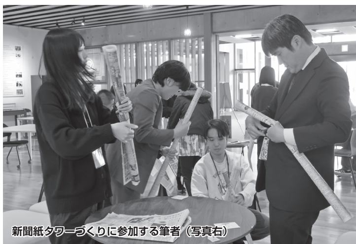
新聞紙タワーズづくりに参加する筆者（写真右）

そこで筆者は、「協働」を「コラボレーション」と捉えるべきだと思っています。立場や考えの違いはあるが協力して新しいものを創り出す、それがコラボレーションです。もう少し詳しく、組織と組織とのコラボレーションは、「参加する各組織が持つ専門技術や知識、考え方、文化や歴史など（＝資源）を組み合わせて、より大きな価値（＝相乗効果を生み出すこと）」であると考えています。